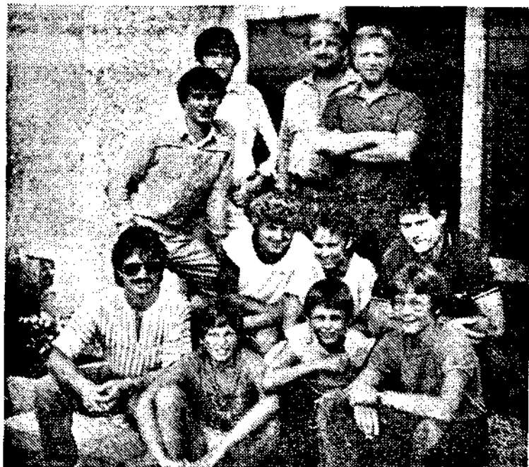
Wieder einmal nützten die heimischen TT-Asse ein Trainingslager in der ČSSR zur Vorbereitung auf die Meisterschaft.