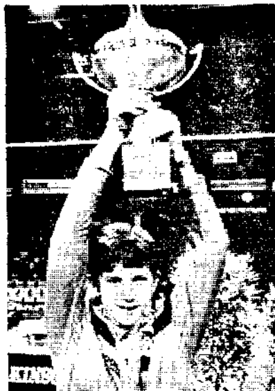
Belgiens erster TT-Europameister — Schülerlegende Jean-Michel Saive (Bild).

Bei Teilnahme an Turnieren mit Geldpreisen würde die Olympiateilnahme nicht gefährdet sein, wenn diese Turniere durch das ITTF (Internationaler TT-Verband) anerkannt sind. Beträgt der höchste Einzelpreis nicht mehr als 1250 Schweizer Franken, gilt die Anerkennung automatisch, bis 500.000 Schweizer Franken muß ein Antrag gestellt werden, über diesen Betrag hinausgehende Dotationen werden nicht anerkannt.