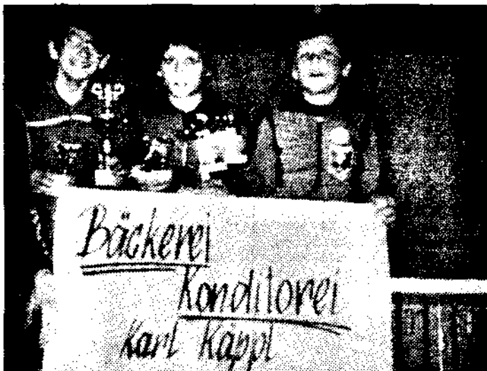
Der Trismaurer Nachwuchs schlug sich bei den ASKÜ-Bezirksmeisterschaften und dem Trismaurer Jugendturnier ausgezeichnet.