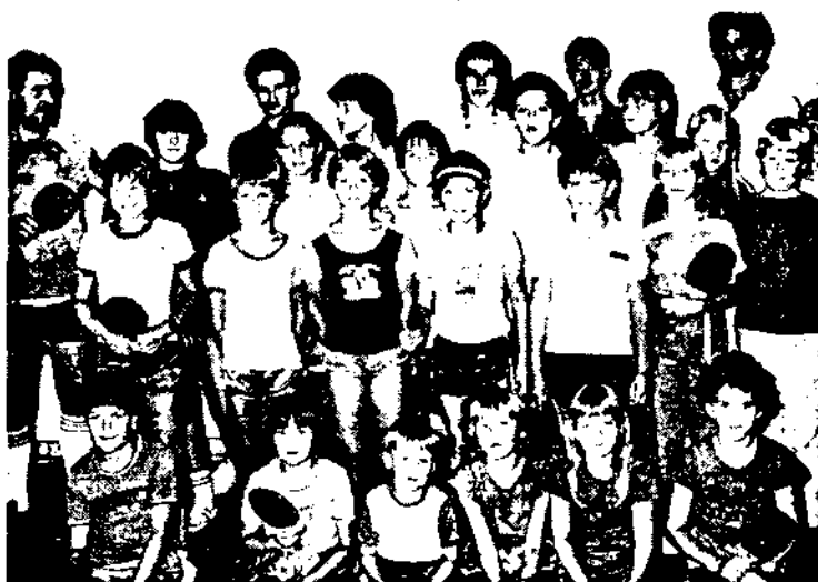
Der Jugendkurs ASKO Hoheneich/Gmund mit 24 Teilnehmern ging am vergangenen Wochenende zu Ende.

Verein erwartet sich wieder mehrgute Spieler für die nächsten Jahre und vor allem eine Steigerung des Spielniveaus, um in den NÖ-Klassen vorne mitmischen zu können.