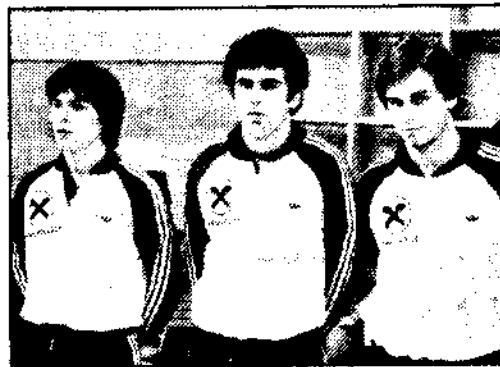
NÖ LANDZEITUNG, KREMS 28.3.1983